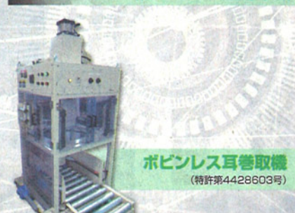
ポピンレス耳巻取機 (特許第4428603号)