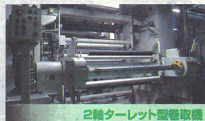
2軸ターレット型巻取機

電気、制御も自社で設計し、組立配線後、社内にて試運転調整、そして現地据付までを一貫して行います。